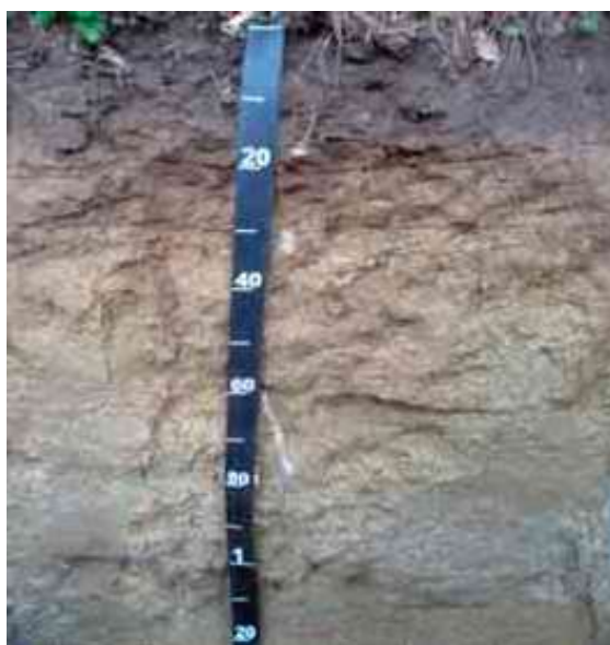
Figura 23. Perfil del suelo Yerba Buena, San José de las Matas.

Desde el punto de vista químico (Tabla 60), el epipedón del perfil del suelo presenta un contenido de MO bajo, de 2.20 %; pH adecuado, de 5.96; CE adecuada, de 0.03 mmhos/cm; P bajo, con 0.44 ppm.