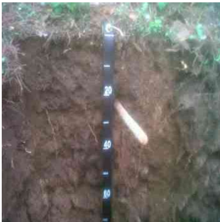
Figura 27. Perfil del suelo La Bija, El Aguacatico, Santiago Rodríguez.

Desde el punto de vista químico (Tabla 74), el epipedón del perfil del suelo presenta un contenido de MO adecuado, de 4.32 %; pH bajo, de 5.47; CE adecuada, de 0.05 mmhos/cm; P bajo, de 0.72 ppm; y la H+Al de 0.68 meq/100 ml está elevada.