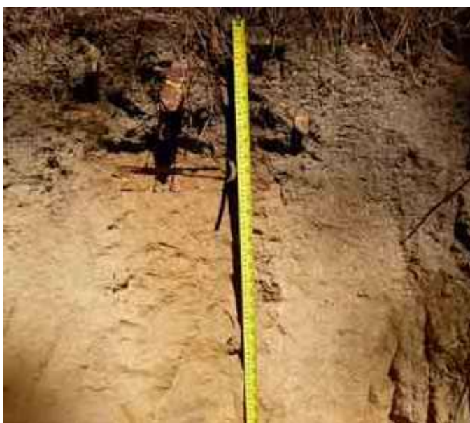
Figura 6. Perfil del suelo de Loma Atravezada, Corocito, Jarabacoa.

Desde el punto de vista químico (Tabla 12), el epipedón del perfil del suelo presenta un contenido de MO adecuado, de 3.64 %. El pH es adecuado, de 5.96 y CE adecuada, de 0.04 mmhos/cm. El P, con 1.33 ppm es bajo.