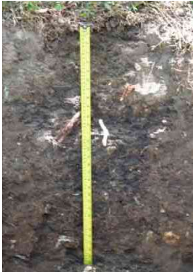
Figura 3. Perfil del suelo de Hato Viejo, Jarabacoa, La Vega.

Desde el punto de vista químico (Tabla 6), el epipedón presenta un contenido de MO bajo, de 2.54 %. El pH es adecuado y medianamente ácido, de 5.89. Sin problemas de sales, con CE de 0.3 mmhos/cm. El P con un contenido de 2.37 ppm se presenta bajo.