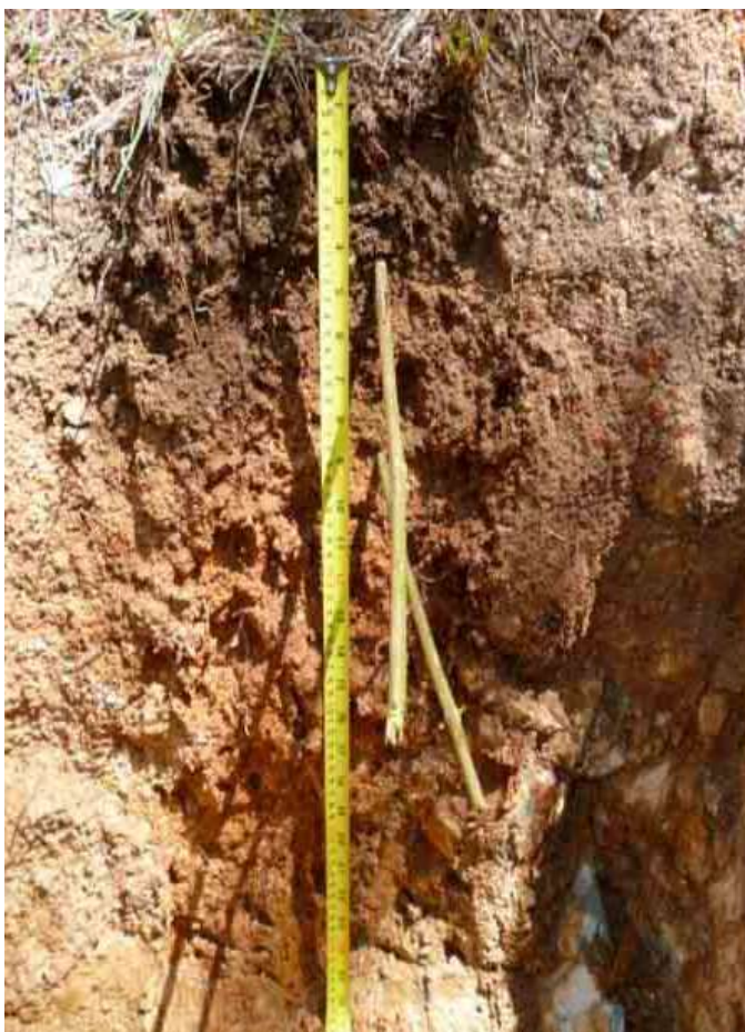
Figura 2. Perfil de suelo de la finca de Hato Viejo, Jarabacoa, La Vega.

Desde el punto de vista químico (Tabla 4) el epipedón presenta un nivel de MO bajo, de 2.20 %. El pH es ligeramente ácido de 6.53. No presenta problemas de sales, con una CE de 0.019 mmhos/cm. El P con nivel bajo, de 10.82 ppm. El K es bajo, con 0.05 meq/100 ml; el Ca, con 24.58 meq/100 ml, está adecuado; Mg, con 9.57 meq/100 ml, está elevado; Na, con 0.21 meq/100 ml, es adecuado. La CICE es alta, con 34.41 meq/100 ml.