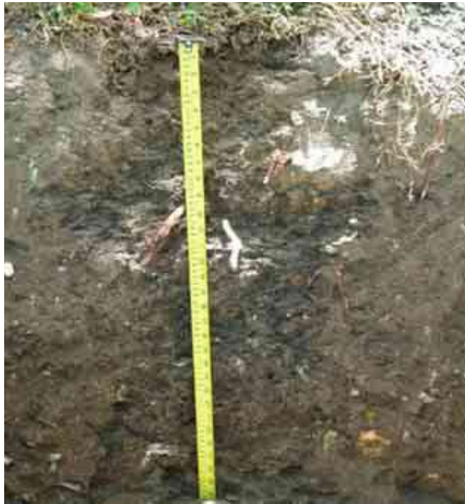
Figura 26. Perfil del suelo Clavijo Arriba, Santiago Rodríguez.

Desde el punto de vista químico (Tabla 68), el epipedón del perfil del suelo presenta un contenido de MO bajo, de 2.10 %; pH adecuado, de 6.61; CE elevada, de 1.23 mmhos/cm; y P bajo, de 2.96 ppm (menos de 20).