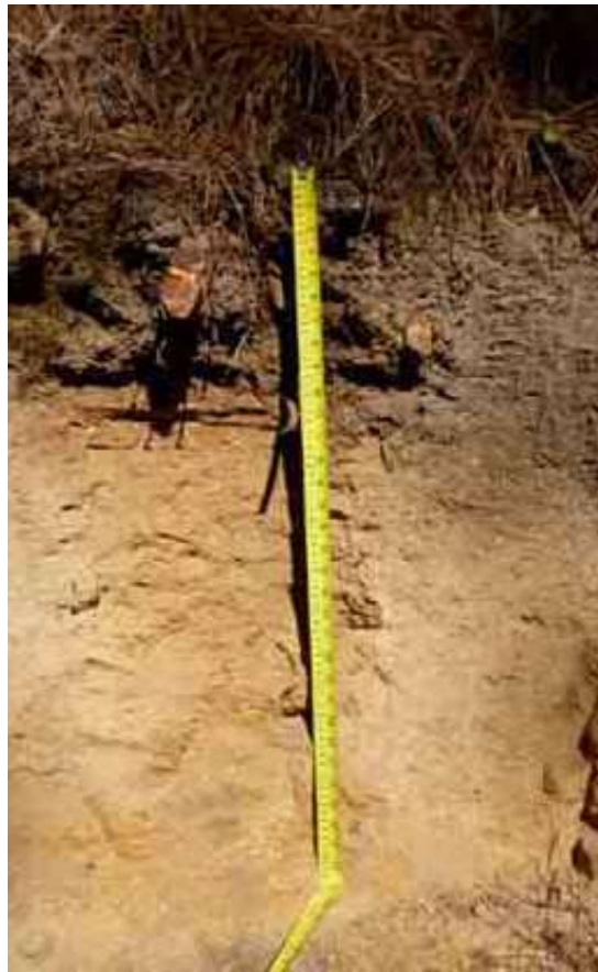
Figura 5. Perfil del suelo de Junumucú, Jarabacoa, La Vega.

Desde el punto de vista químico (Tabla 10), el epipedón del perfil del suelo presenta un contenido de MO bajo, de 2.76. El pH extremadamente ácido, de 5.27. Sin problemas de sales, con CE de 0.02 mmhos/cm, y P muy bajo, con 2.22 ppm.