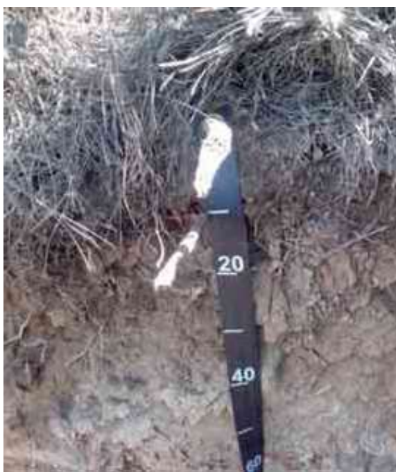
Figura 25. Perfil del suelo Gurabo, Dúran, Santiago Rodríguez.

Desde el punto de vista químico (Tabla 66), el epipedón del perfil del suelo presenta un contenido de MO bajo, de 2.88 %; pH adecuado, de 5.56; CE adecuada, de 0.09 mmhos/cm; P bajo, de 4.00 ppm.