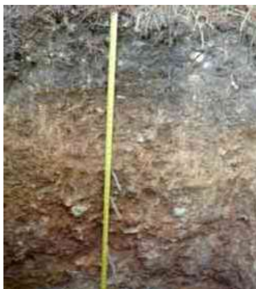
Figura 16. Perfil del suelo de Tireo al Medio, Tireo, Constanza.

Desde el punto de vista químico (Tabla 34), el epipedón del perfil del suelo presenta un contenido de MO baja, de 2.43 %; el pH de 5.18 es bajo; CE de 0.02 mmhos/cm es adecuada; el P, con 1.19 ppm es bajo.