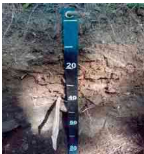
Figura 24. Perfil del suelo Gurabo, Dúran, Santiago Rodríguez.

Desde el punto de vista químico (Tabla 62), el epipedón del perfil del suelo presenta un contenido de MO bajo, de 1.99 %; el pH de 6.29 es adecuado; la CE mmhos/cm es adecuada; y el P, con 3.56 ppm está bajo.