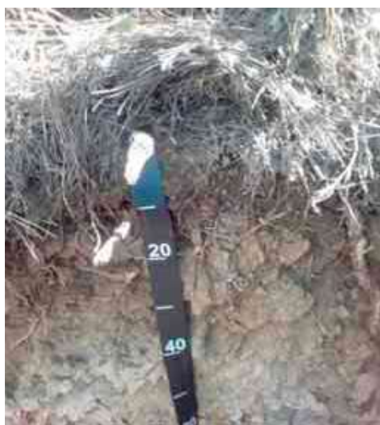
Figura 20. Perfil del suelo El Naranjo, Inoa, San José de las Matas.

Desde el punto de vista químico (Tabla 54), el epipedón del perfil del suelo presenta un contenido de MO de 2.42 % bajo, pH de 5.32 bajo; la CE adecuada, de 0.07 mmhos/cm; el P de 2.67 ppm bajo.