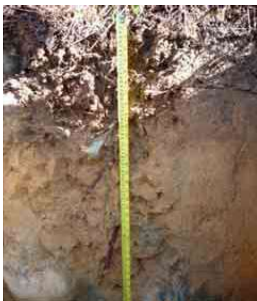
Figura 7. Perfil del suelo de Tierra del Toro, Paso Bajito, Jarabacoa, La Vega.

Desde el punto de vista químico (Tabla 14), el epipedón del perfil del suelo presenta un contenido de MO adecuado, de 4.62 %; pH bajo, de 5.20 y extremadamente ácido; P sumamente bajo, de 0.89 ppm. El K, con 0.11 meq/100 ml está bajo; el calcio adecuado, con 4.70 meq/100 ml; el Mg es adecuado, con 5.07 meq/100 ml; el Na, con 0.46 meq/100 ml y la CICE, con 10.35 meq/100 ml.