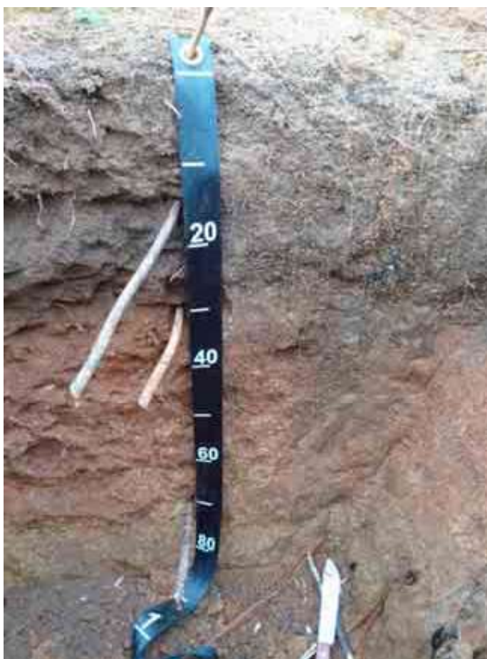
Figura 21. Perfil del suelo La Peña, Yerba Buena, Jarabacoa, La Vega.

Desde el punto de vista químico (Tabla 56), el epipedón del perfil del suelo presenta un contenido de MO bajo, de 2.52 %, el pH de 5.55 es adecuado, la CE de 0.08 es adecuada y el P de 3.56 ppm está bajo.