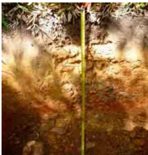
Figura 10. Perfil del suelo de La Peña, Yerba Buena, La Vega.

Desde el punto de vista químico (Tabla 20), el epipedón del perfil del suelo presenta un contenido de MO adecuado, de 3.31 %; pH bajo, de 5.29 y extremadamente ácido; CE adecuada, de 0.03; y P elevado, con 57.79 ppm.