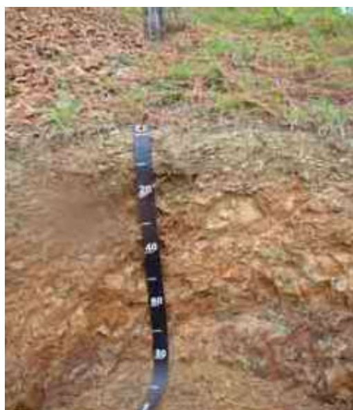
Figura 19. Perfil del suelo de Las 4 Esquinas, El Rubio, San José de la Matas.

Desde el punto de vista químico (Tabla 42), el epipedón del perfil del suelo presenta un contenido de MO muy elevado, 7.12 %, el pH de 5.91 es adecuado, la CE de 0.06 es adecuada y el P de 2.96 ppm es bajo. El K, con 0.06 meq/100 ml es bajo; el Ca, con 17.05 meq/100 ml es adecuado; el Mg, con 7.87 meq/100 ml es adecuado; el Na, con 0.13 meq/100 ml es adecuado; y la CICE, con 25.11 meq/100 ml es adecuada.