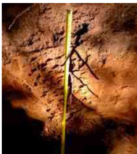
Figura 9. Perfil del suelo de Arroyo La Pita, Paso bajito, Jarabacoa, La Vega.

Desde el punto de vista químico (Tabla 18), el epipedón del perfil del suelo presenta un contenido de MO bajo, de 1.78 %; pH de 7.21 ligeramente alcalino y elevado; la CE adecuada, de 0.12 mmhos/cm; y P elevado, de 223.75 ppm.