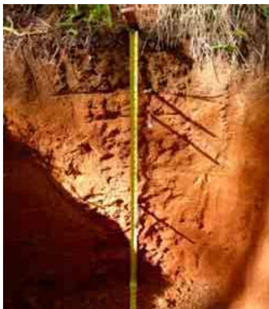
Figura 8. Perfil del suelo de Hato Viejo, Jarabacoa, La Vega.

Desde el punto de vista químico (Tabla 16), el epipedón del perfil del suelo presenta un contenido bajo de MO, de 2.87 %. Un pH adecuado, de 6.12 y ligeramente ácido; sin problemas de sales, con una CE de 0.05 mmhos/cm y con un contenido de P bajo, de 5.33 ppm.