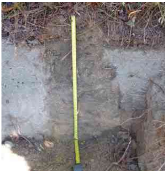
Figura 4. Perfil del suelo de Junumucú, Jarabacoa, La Vega.

Desde el punto de vista químico (Tabla 8), el epipedón del perfil del suelo presenta un contenido de MO adecuado, de 3.29 %. El pH de 6.16 es adecuado, CE adecuada, de 0.02 mmhs/ cm y el P bajo, con 10.67 ppm.