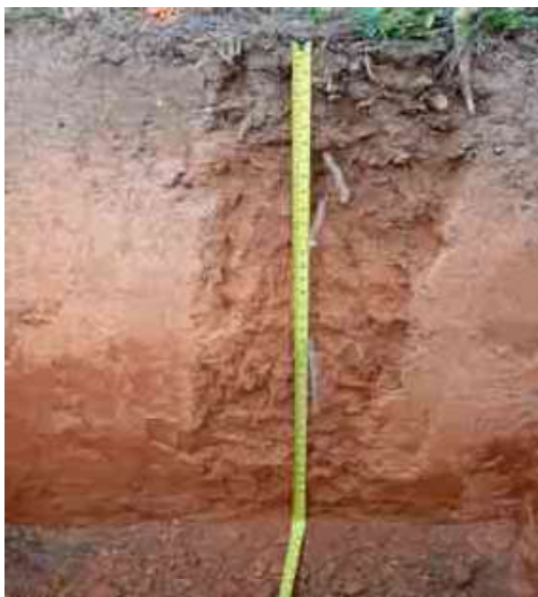
Figura 12. Perfil de suelos Los Guanchos, Pino de Rayo, La Vega.

Desde el punto de vista químico (Tabla 24), el epipedón del perfil del suelo presenta un contenido de MO adecuado, de 5.28 %, el pH de 5.24 es bajo y medianamente ácido, la CE es de 0.03 mmhos/cm y adecuada, el P de 0.89 ppm es bajo.