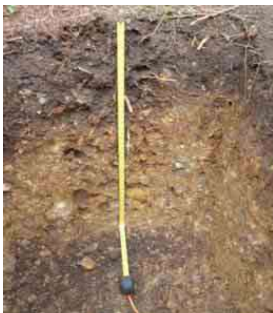
Figura 14. Perfil del suelo de El Maizal, Colonia Japonesa, Constanza, La Vega.

Desde el punto de vista químico (Tabla 28), el epipedón del perfil del suelo presenta un contenido de MO adecuado, de 5.43 %, el pH de 5.74 es adecuado, la CE de 0.03 mmhos/cm es adecuada, P de 1.78 ppm es bajo (menos de 20).