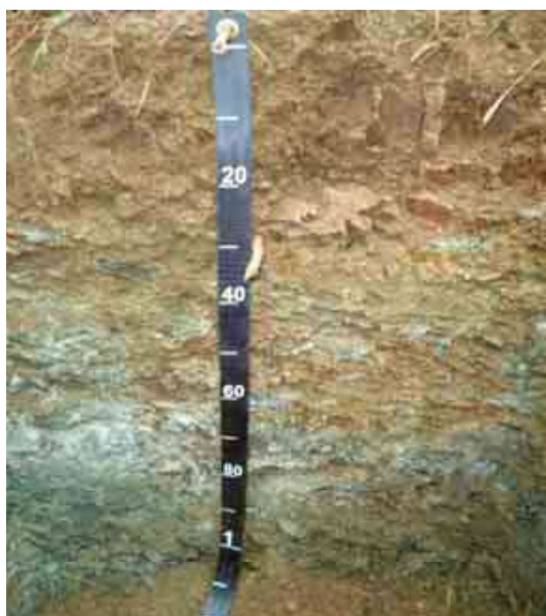
Figura 22. Perfil del suelo Yerba Buena, San José de las Matas.

Desde el punto de vista químico (Tabla 58), el epipedón del perfil del suelo presenta un contenido de MO adecuado, de 3.62 %; el P es adecuado, de 6.32; la CE de 0.04 mmhos/cm es adecuada; el P, con 5.33 ppm está bajo.