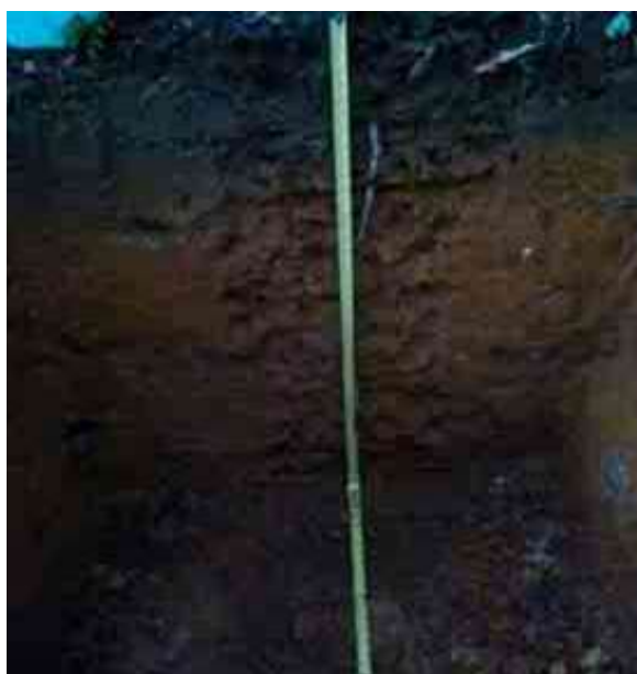
Figura 13. Perfil del suelo de Angostura Manabao, Jarabacoa, La Vega.

Desde el punto de vista químico (Tabla 26), el epipedón presenta un contenido de MO adecuado, de 4.40 %; el pH de 5.07 es bajo y medianamente ácido; la CE de 0.06 mmhos/cm es adecuada; y el P, con 0.59 ppm es bajo.