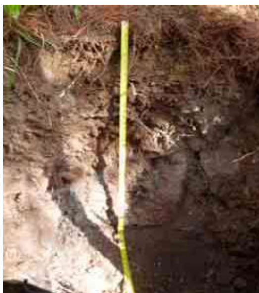
Figura 17. Perfil del suelo de La Colonia Kennedy, Constanza, La Vega.

Desde el punto de vista químico (Tabla 36), el epipedón del perfil del suelo presenta un contenido de MO adecuado, de 3.31 %, el pH de 5.39 bajo, la CE de 0.03 mmhos/cm adecuada, el P de 57.79 ppm es elevado, el H+Al de 0.45 meq/100 ml es adecuada.