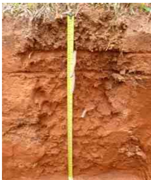
Figura 11. Perfil de suelos de Manabao, Pino de Rayo, Jarabacoa, La Vega.

Desde el punto de vista químico (Tabla 22), el epipedón del perfil del suelo presenta un contenido de MO adecuado; el pH es bajo, de 5.38 y medianamente ácido; la CE de 0.03 mmhos/cm es adecuada; y el P, con 13.34 ppm es bajo.