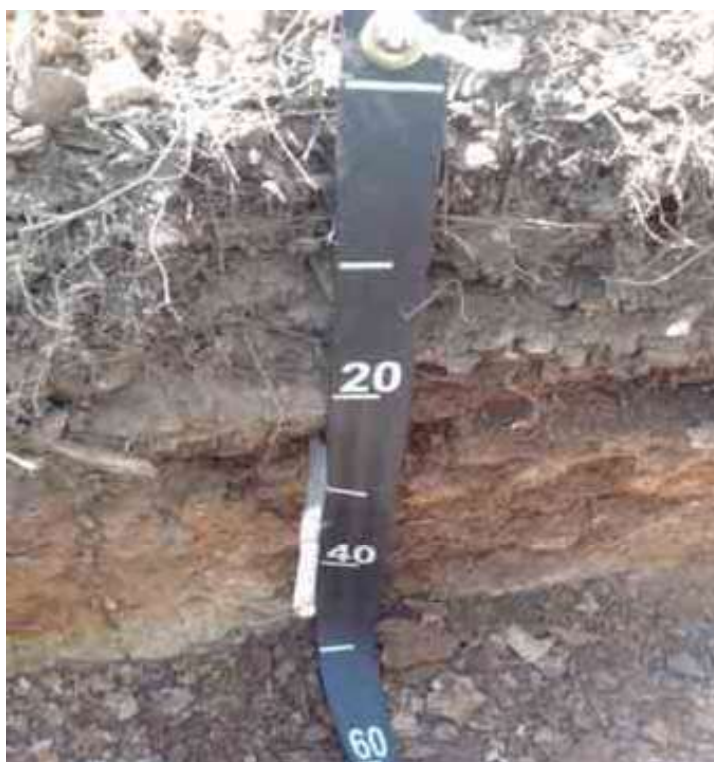
Figura 29. Perfil del suelo Gurabo, Monción Santiago Rodríguez.

Desde el punto de vista químico (Tabla 78), el epipedón del perfil del suelo presenta un contenido de MO adecuado, de 3.44 %; pH adecuado, de 6.05; CE adecuada, de 0.06 mmhos/cm; y P bajo, con 2.37 ppm.