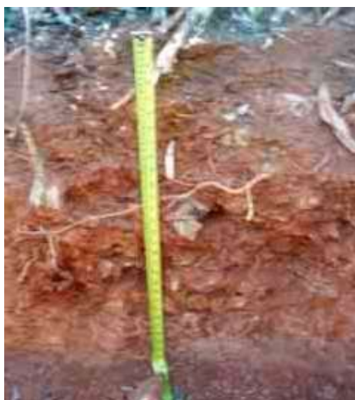
Figura 18. Perfil del suelo de El Corozo, La Bruja, San José de las Matas.

Desde el punto de vista químico (Tabla 38), el epipedón del perfil del suelo presenta un contenido de MO bajo, de 1.75 %; el pH es adecuado, de 6.70; la CE de 0.02 mmhos/cm es adecuada; el P de 5.48 ppm es bajo.