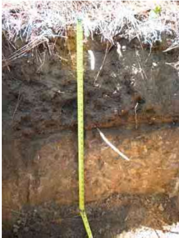
Figura 1. Perfil de suelo de la localidad de Hatillo, Jarabacoa.

Desde el punto de vista químico (Tabla 2), el epipedón presenta un contenido de MO adecuado, de 4.84 % (entre 3.5 y 7 %). El pH es bajo y mediadamente ácido de 5.27 (menor de 5.5). Conductividad eléctrica (CE) adecuada, de 0.09 mmhos/cm (menos de 0.7 mmhos/cm), fósforo (P) bajo, con contenido de 2.52 ppm (menos de 20 ppm).