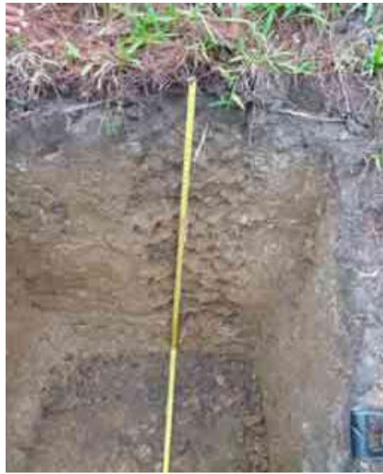
Figura 15. Perfil del suelo de La Cienaguita, Los Maldonados, Constanza, La Vega.

Desde el punto de vista químico (Tabla 30), el epipedón del perfil del suelo presenta un contenido de MO adecuado, de 3.33 %; el pH en agua de 5.5 es adecuado; sin problemas de sales, con CE de 0.03 mmhos/cm; y P bajo, de 10.67 ppm.