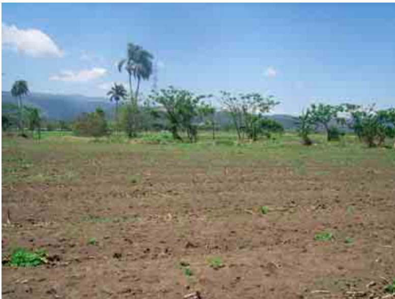
Foto 4. Vista del sector 2 la alcantarilla.