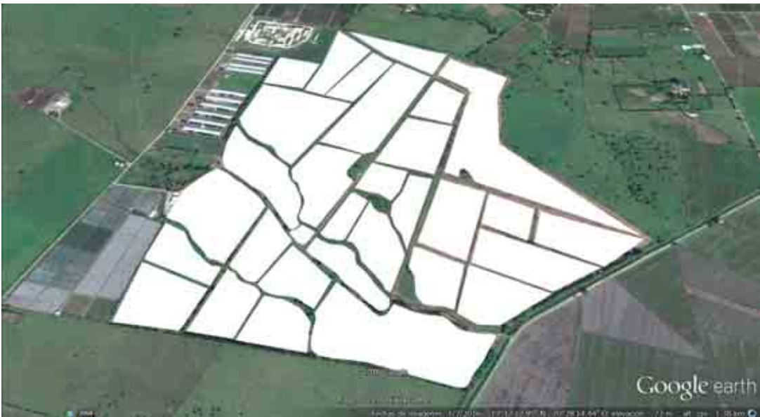
Figura 1. Panorámica visual de la Estación Experimental Sabaneta y distribución de lotes.

El estudio se realizó en la finca experimental del Idiaf localizado en Sabaneta, La Vega. El área fue estratificada en tres sectores (frontal, la alcantarilla y la guayaba, Anexo 1) para el muestreo de los suelos. La Provincia de la Vega está localizada en el Valle del Cibao. Se encuentra a una altitud de 95 msnm, con una precipitación media anual de 1,400 mm y una temperatura media de 26.2 °C. El relieve es regular en la parte plana (Núñez y Cuevas, 2004). La distribución de los lotes de producción de la finca y una vista panorámica se presenta en la Figura 1.