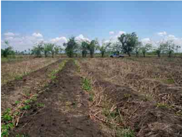
Foto 3. Vista del sector frontal I de la finca.