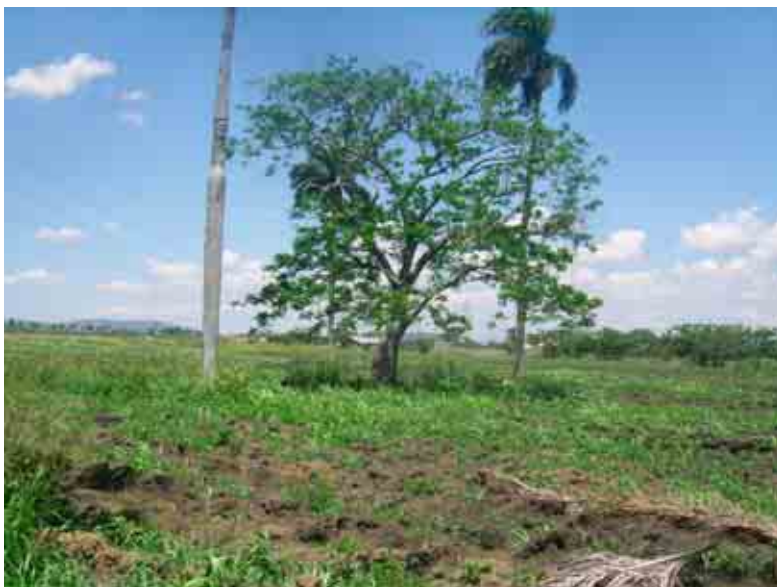
Foto 2. Vista panorámica del suelo cubierto de malezas.