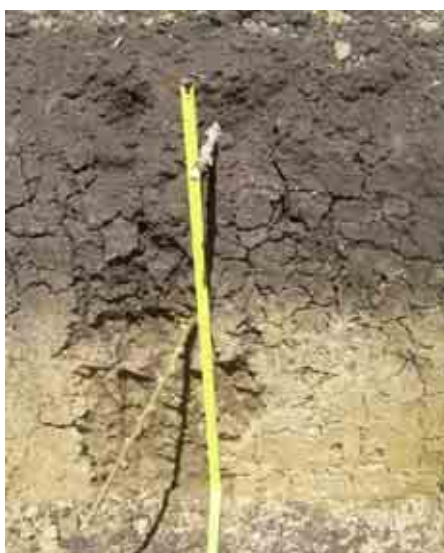
Figura 2. Perfil I de finca de Sabaneta del Idiaf.

En términos físicos, presenta un epipedón (Ap) de 10 cm de profundidad (0-10 cm) de color negro (10YR2/1). Textura franco-arcillosa, estructura en bloques angulares gruesos y fuertes, consistencia friable. Escasas concreciones de Fe y Mn. Abundantes raíces medias y finas. Actividad biológica alta. Limite claro y plano. No reacción al HCl. pH de 6.08. Este descansa sobre un horizonte de color negro (10YR2/1) en húmedo y de 30 cm (10-40 cm) de espesor. Textura arcillosa, estructura en bloques subangulares gruesos y moderados. Con presencia de Slikenside. Raíces moderadas y finas. Actividad biológica moderada. Limite claro y plano. No reacción al HCl y pH de 7.01. Finalmente, aparece un horizonte sobre los 40 cm de profundidad que presenta un color marrón (10TR4/3). Textura arcillosa, estructura en bloques subangulares medios y moderados. Escasas raíces. Actividad biológica muy baja. Limite claro y plano. No reacción al HCl y pH de 8.10 (Figura 2, Tabla 1).