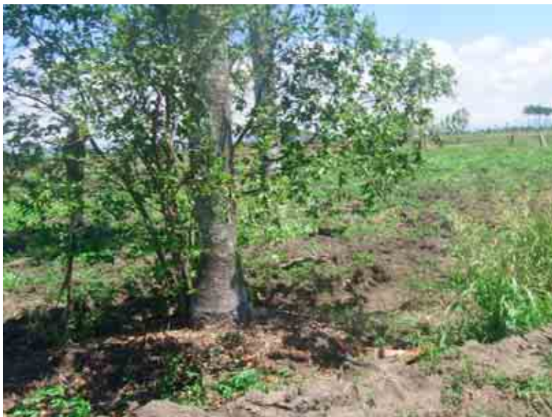
Foto 1. Vista del sector 3 La Guayaba.