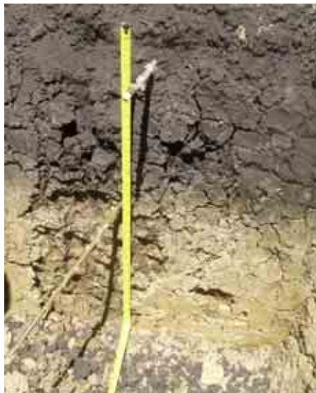
Figura 4. Perfil 3 de la finca de Sabaneta del Idiaf.

En términos físicos, presenta un epipedón (Ap) de 40 cm de profundidad (0-40 cm) de color negro (10YR2/1). Textura arcillo arenosa, estructura granular. Escasas concreciones de Fe y Mn. Abundantes raíces medias y finas. Actividad biológica alta. Límite claro y plano. No reacción al HCl. pH de 6.85. Este descansa sobre un horizonte de color negro (10YR2/1) en húmedo y de 30 cm (40-70 cm) de espesor. Textura arcillosa, estructura en bloque subangulares gruesos y moderados. Con presencia de Slikenside, presencia de raíces moderadas y finas. Actividad biológica moderada. Límite claro y plano. No reacción al HCl y pH de 7.12. Finalmente, aparece un horizonte sobre los 70 cm de profundidad que presenta un color marrón (10YR4/3). Textura arcillosa, estructura en bloques subangulares medios y moderados. Escasas raíces. Actividad biológica muy baja. Límite claro y plano. No reacción al HCl y pH de 7.57 (Figura 4, Tabla 5).