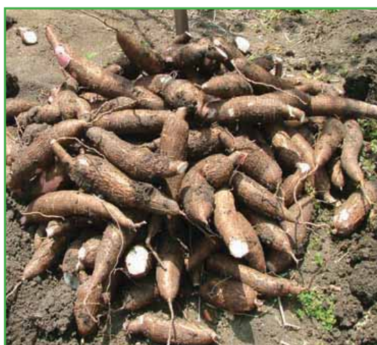
Cosecha de las variedades 'Americanita' (izquierda, 31 qq/ta) y 'Valencia' (derecha, 34.5 qq/ta) procedente de plántulas del invernadero