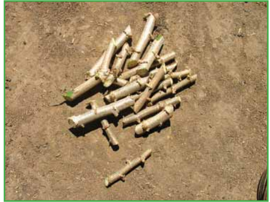
Proceso de manejo tradicional de los esquejes de yuca

Por su parte, las vitro plántulas se obtienen a partir de yemas, mediante cultivo de tejidos en laboratorios. Con este método se logran plantas sanas, de una sola variedad y buen vigor. Es un método poco utilizado en la República Dominicana debido a su alto costo. No obstante, es el más eficiente en cuanto a pureza y sanidad del material; pero necesita una etapa de aclimatación o endurecimiento antes de llevar las plántulas al campo. En la producción masiva de material de siembra, el endurecimiento constituye un cuello de botella por la alta mortalidad (CLAYUCA 2006). A continuación, se muestran imágenes de la producción de vitro plántulas.