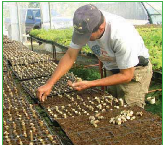
Colocación de esquejes en la bandeja