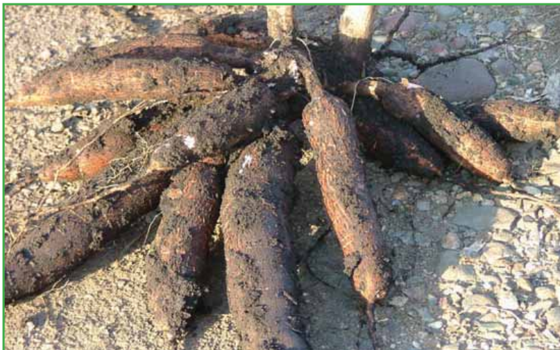
Variedad 'Valencia' procedente de plántulas del invernadero (7 meses de edad)