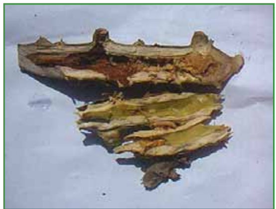
Daños provocado por el Gusano Barrenador

Principales plagas transmitidas por material de siembra