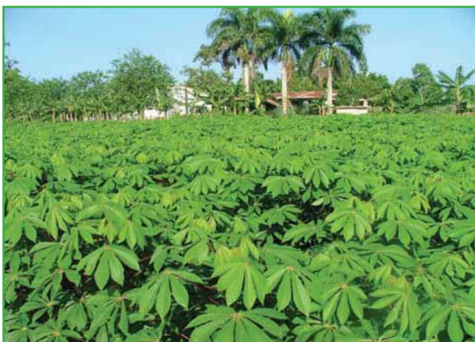
Plantación en condiciones favorables para la obtención de material

El material a multiplicar debe ser seleccionado en plantaciones con un historial de buen manejo fitosanitario. Éste debe estar sano, en buenas condiciones fisiológicas y sin mezcla varietal.