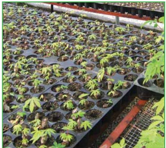
Plantación adecuada de los ápices en las bandejas