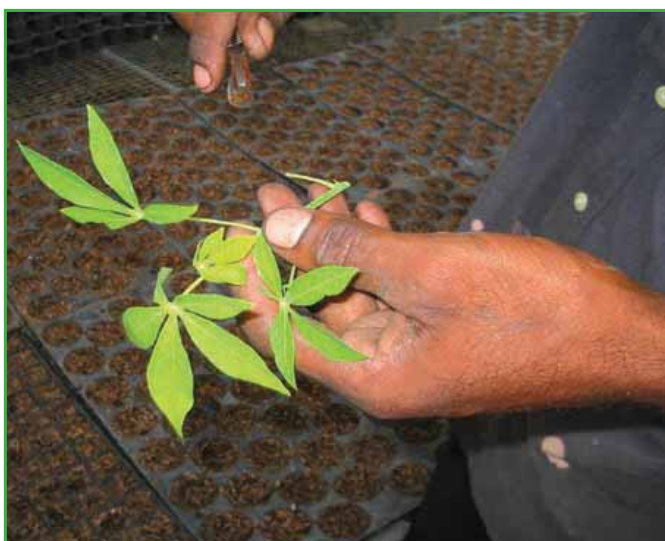
Acción del corte y deshoje de los ápices

A los ápices se le eliminan las hojas, excepto la yema apical (cogollo) para evitar la deshidratación. Las hojas se cortan dejando alrededor de dos centímetros del pecíolo. Esta actividad se realiza con los mismos instrumentos usados para el corte de los ápices.