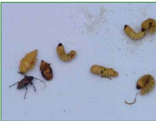
Larva y adulto del Gusano Barrenador del tallo ( Lagocheirus sp).