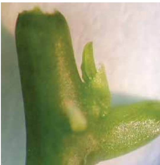
Material para la multiplicación

Por su parte, las vitro plántulas se obtienen a partir de yemas, mediante cultivo de tejidos en laboratorios. Con este método se logran plantas sanas, de una sola variedad y buen vigor. Es un método poco utilizado en la República Dominicana debido a su alto costo. No obstante, es el más eficiente en cuanto a pureza y sanidad del material; pero necesita una etapa de aclimatación o endurecimiento antes de llevar las plántulas al campo. En la producción masiva de material de siembra, el endurecimiento constituye un cuello de botella por la alta mortalidad (CLAYUCA 2006). A continuación, se muestran imágenes de la producción de vitro plántulas.