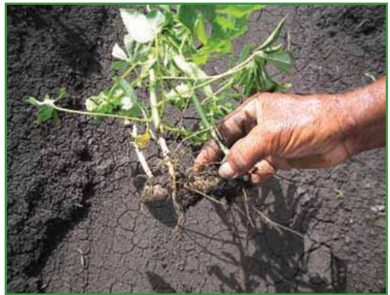
Pudrición de las raíces por causa del ataque de hongos ( Fusarium ).