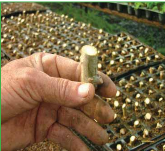
Esqueje con la yema hacia arriba

Previo a la plantación de esquejes, el sustrato en las bandejas debe ser humedecido y desinfectado con fungicida. Los esquejes picados y desinfectados, se plantan en las bandejas en posición vertical, con las yemas hacia arriba. Los mismos deben colocarse a una profundidad no mayor de 2 cm, en el centro del hoyo.