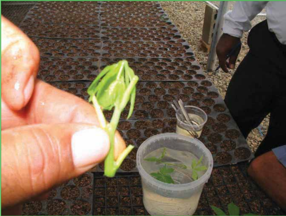
Colocación de los ápices en agua limpia para que el látex se disuelva