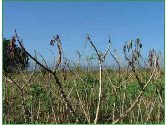
Xanthomonas spp (Bacteriosis)