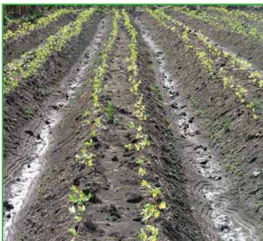
Establecimiento de plántulas en el campo y apariencia después de sembradas