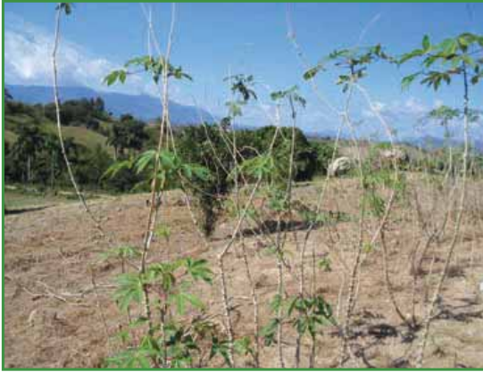
Sphacelonus (Superalargamiento del Tallo)