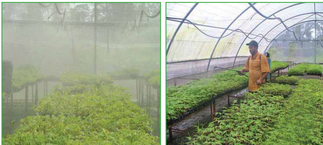
El riego por nebulización garantiza una humedad adecuada a las plántulas

Durante esta etapa hay que garantizar alta humedad en el sustrato y en el ambiente para reducir la mortalidad. Se recomienda mojar dos o tres veces todos los días. El riego debe realizarse, preferiblemente, con aspersores que mojen a alta presión con mínimo gasto de agua. La duración del riego debe ser alrededor de 15 minutos.