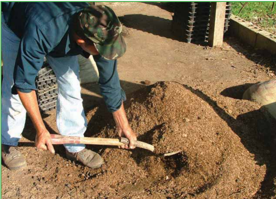
Proceso de mezclado de los materiales para el sustrato

Actualmente, a través del Proyecto de Agricultura Sostenible (JICA, IDIAF y SEA), la Misión Japonesa está realizando trabajos de investigación sobre preparación y uso de sustratos en el Cibao Central.