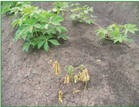
Muerte de la planta por marchitez (provocado por el hongo Fusarium )