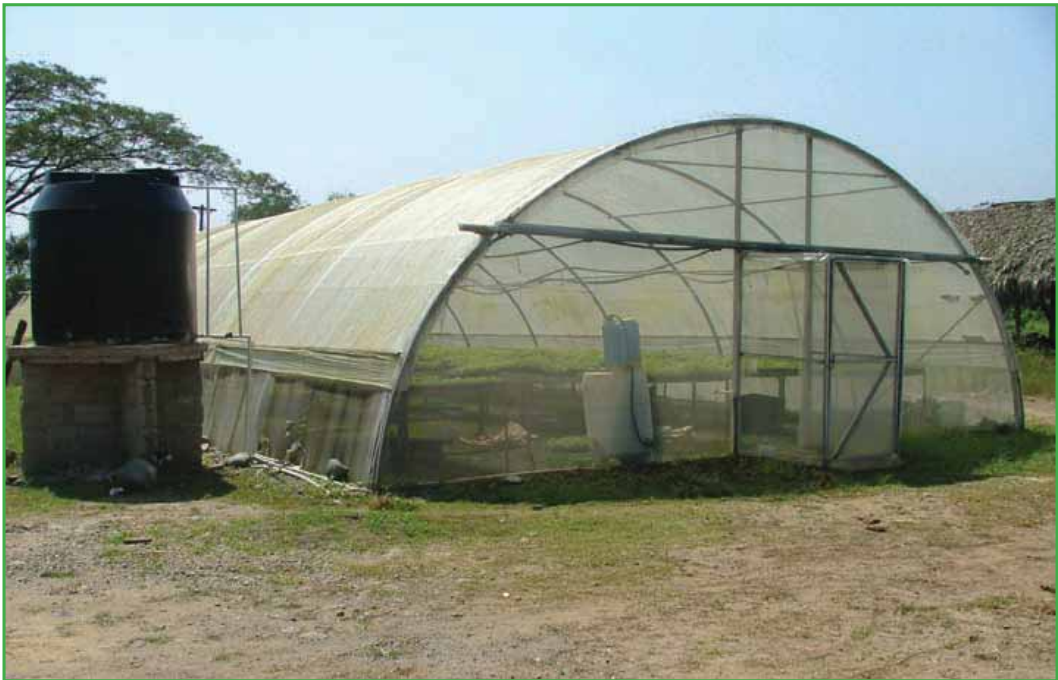
Invernadero utilizado para la multiplicación de yuca

y 18,000 plántulas en un año, a partir de una sola planta, considerando 15 a 20% de mortalidad. El procedimiento para la producción de plántulas por el método modificado de multiplicación rápida de yuca en invernadero se explica detalladamente a continuación.