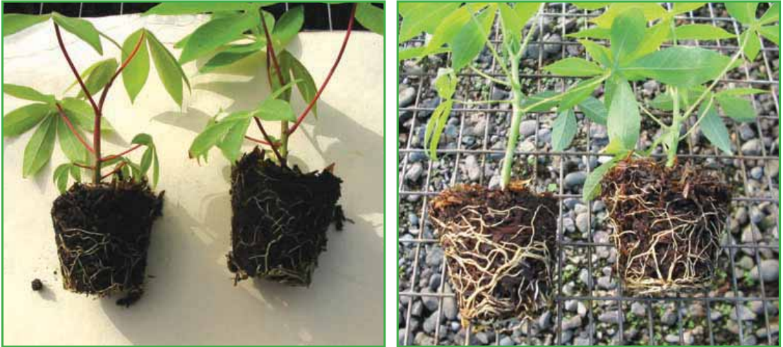
Plántulas de las variedades 'Valencia' (izquierda) y 'Americanita' (derecha) listas para la siembra.

Con esto termina el proceso para la multiplicación rápida de plántulas de yuca.